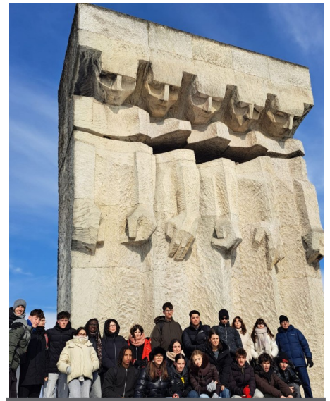
Plaszow: Monument Cors trencats

Els alumnes de l'INS Francisco de Goya, juntament amb els membres de l'Amical de Mauthausen i altres camps, van realitzar diversos actes d'homenatge a les víctimes de la barbàrie nazi.