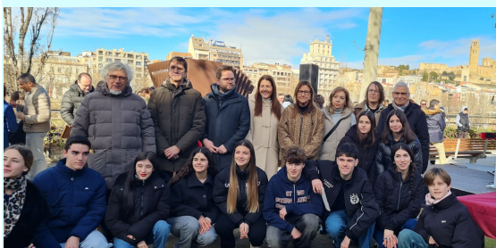
Dia en Memòria de l'Holocaust a Lleida.

En l'àmbit institucional i commemoratiu, es van celebrar actes d'homenatge amb la col·laboració de diversos ajuntaments i institucions, com ara Les Franqueses, Sant Boi de Llobregat, Lleida, Barcelona, Blanes, Sabadell, Gavà, Terrassa, Mataró, Cerdanyola, Valls i Fontscaldes, així com amb la Generalitat de Catalunya. Tam-