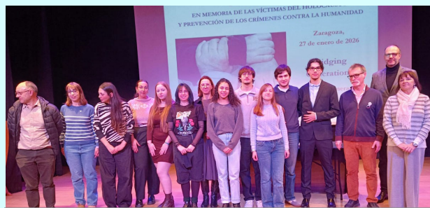
Celebració Dia en Memòria Holocaust a Saragossa.

Finalment, es van organitzar exposicions i actes culturals, com Republicans espanyols als camps nazis a l'IES Sierra la Mesta de Santa Amalia (Càceres), la participació a la inauguració de l'exposició Generació TOP a Terrassa i l'exposició sobre el camp d'Agde a El Vendrell.