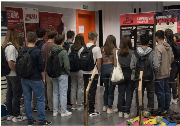
Alumnes de l'Ikastola pública d'Izarra visitant una exposició.

Gràcies a aquest model de col·laboració, la nostra delegació ha pogut participar en activitats educatives en diferents centres de Guipúscoa, explicant a l'alumnat el procés històric que va portar milers de republicans espanyols a l'exili després de la Guerra Civil i, posteriorment, a la deportació als camps de concentració nazis. En aquestes sessions s'abor-