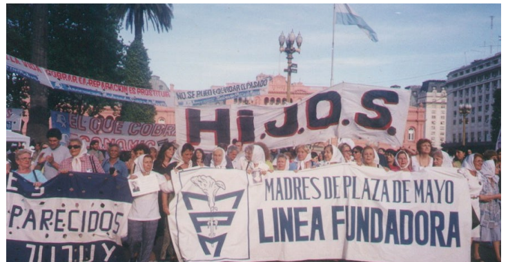
Mares a la Plaza de Mayo

Agraeixo aquesta entrevista i permetin-me reflexionar sobre l'absència d'un ésser estimat: el buit, el forat que es sent fins i tot al cos. La Convenció Internacional contra la desaparició forçada reconeix els familiars com a vícti-