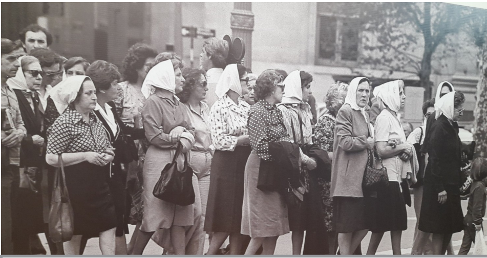
Antiga foto de MLF sortint de visitar una Institució.

dels argentins sobre la història recent no ha disminuït: ha augmentat.