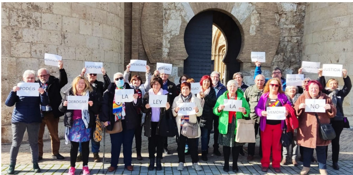
Manifestació de PAMA davant les Corts d'Aragó

governa l'Aragó no existeix la memòria democràtica i que cal condemnar el franquisme, no perquè va ser un govern de dretes, sinó perquè va ser una dictadura que va comportar que milers de persones fossin assassina-