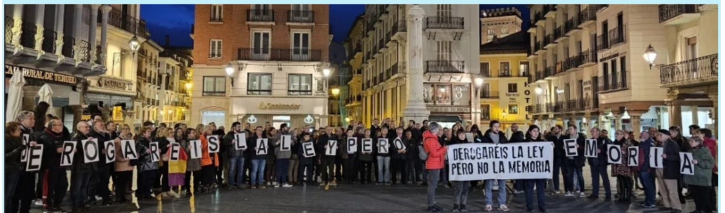
Manifestació a Terol, el 22 de febrer, contra la derogació de la Llei de Memòria Democràtica d'Aragó.

sats a donar a conèixer entre el seu alumnat el que va ser i va significar la deportació republicana, les polítiques d'extermini i, per extensió, l'Holocaust jueu, amb la doble finalitat de donar a conèixer el que va passar en aquell fosc passat i prevenir dels potencials