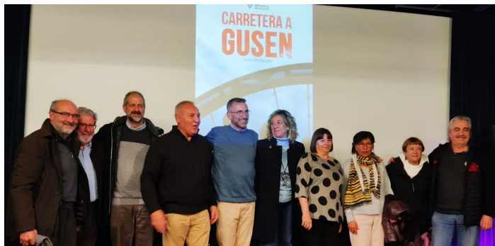
Carretera a Gusen a la Filmoteca de Saragossa

L'exposició es va mantenir a Monzón durant 10 dies gràcies a la col·laboració entre l'Amical de Mauthausen i altres camps, l'ajuntament de Monzón i la CNT-Zinca (Aragón - Rioja) .