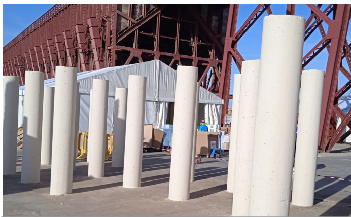
Agressió al monument d'Almeria

va fer la fotografia que acompanya aquest text.