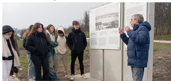
Camp de Plaszow

Plaszow i els camps d'Auschwitz i Auschwitz-Birkenau on van realitzar actes d'homenatge a les víctimes de la barbàrie nazi.