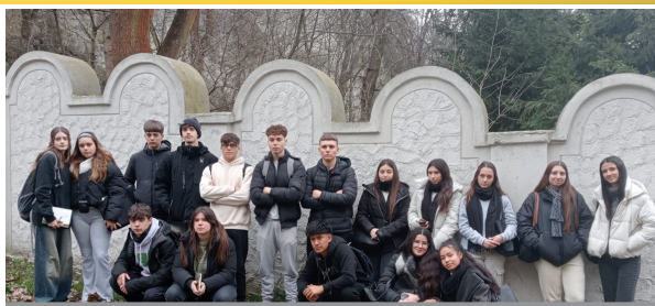
Mur del Gueto de Cracòvia

Els alumnes acompanyats per experts de l' Amical de Mauthausen i altres camps van visitar l'antic barri