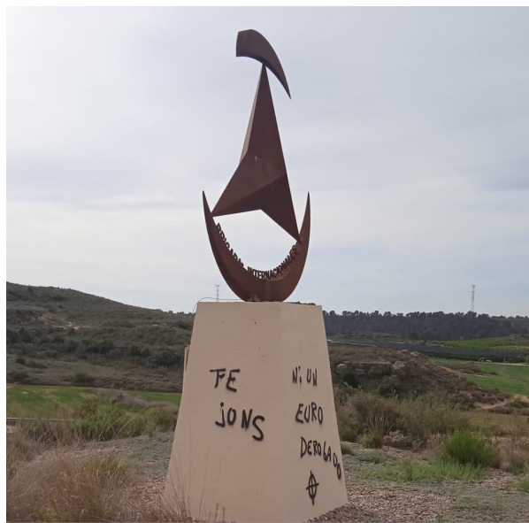
Agressió al monument als Brigadistes a Casp