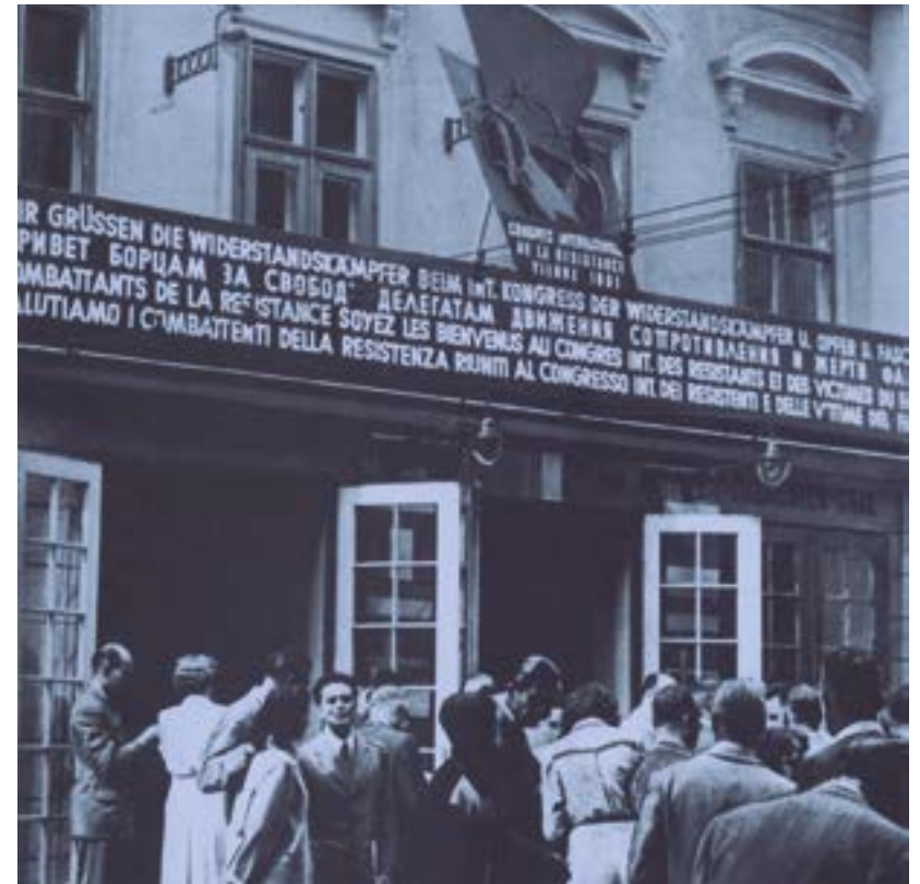
Congreso constituyente de la F.I.R. Viena, 1951

deportados y víctimas del fascismo (F.I.A.P.P.), en 1947, recién derrotada la Alemania nazi, con el objetivo de hacer valer las justas reivindicaciones de los resistentes y de las víctimas del fascismo. Pero en el clima de la Guerra fría se intentó deliberadamente dividir a quienes arriesgaron sus vidas luchando contra el fascismo, y fue en este contexto cuando se creó la F.I.R., para poner fin a esta situación y poder superar los obstáculos