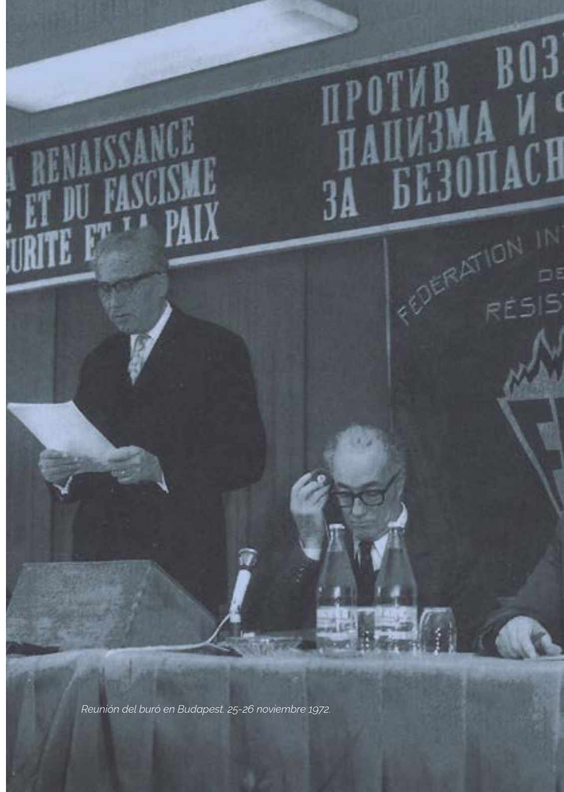
Reunión del buró en Budapest. 25-26 noviembre 1972.

indefensas del terror nazi, los niños, o el seguimiento del juicio contra los asesinos del campo de Auschwitz celebrado en Frankfurt, entre 1963 y 1965, las manifestaciones masivas en Colonia y Estrasburgo para reclamar la disolución de asociaciones de veteranos de las S.S., la reclamación de la no prescripción de los crímenes nazis, etc. El peligro de guerra nuclear impulsó un decidido compromiso en favor del desarme y la paz, que se tradujo en el "Llamamiento de Roma sobre la paz" en 1971, asumido por los veteranos de guerra a través de la consigna de Paz y Política de Distensión y Desarme. Fueron estas iniciativas para el desarme y la cooperación internacional las que determinaron que el Secretario General de las Naciones Unidas, el 15 de septiembre de 1987, designara a la F.I.R. como "mensajero de la paz".