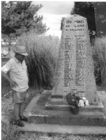
Monument al cementiri d'Argelers.