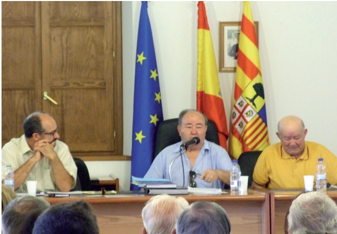
Els germans Rifaterra donant el seu testimoni.

Com en anys precedents, durant el mes d'agost, es van celebrar aquestes Jornades organitzades per l'Amical i l'Ajuntament d'aquesta localitat de Terol en col·laboració amb el "Programa Amarga Memoria" del Govern d'Aragó. En aquesta edició es recolliren testimonis de familiars de diversos aragonesos que foren deportats a Mauthausen.