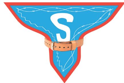
Dibuix: Marta Cardona

estudiants, són possibles, en bona part, gràcies a subvencions i al treball voluntari de tots nosaltres. Aquest darrer, ben segur que no mancarà, tot i això i les noves vies que hem obert per aconseguir finançament, si la retallada en les subvencions és important, tal com preveiem, haurem de replantejar-nos algunes de les activitats, especialment els viatges amb estudiants.