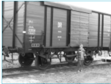
Vagón-exposición sobre los transportes de deportados, Ravensbrück, abril 2005