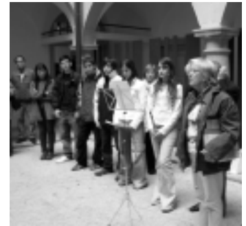
Acto de los alumnos de Castellón, Hartheim, mayo 2005