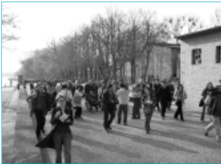
Delegación española en los actos del 60 aniversario en Ravensbrück, abril 2005

Este año las conmemoraciones han tenido un carácter especial. No se trataba solamente de poner de manifiesto la significación de los sesenta años transcurridos desde la liberación de los campos, sino también el inicio de un período de reflexión sobre lo que ha de significar, en el futuro, la preservación de la memoria de la deportación. Tal como quedó claro en los diversos actos, la presencia de las generaciones sucesivas de los supervivientes y también la participación de jóvenes estudiantes, tienen que ser un buen punto de referencia para nuestro trabajo en el futuro, así como también lo ponen de manifiesto las informaciones contenidas en las publicaciones que recibimos desde otros países de asociaciones amigas. Además, en el caso de nuestro país, por primera vez los supervivientes recibieron el reconocimiento oficial que merecían y tan largamente aplazado, a través de la presencia del jefe del gobierno español y autoridades autonómicas en Mauthausen y de una nutrida representación de la Generalitat de Catalunya en Ravensbrück. Confiamos en seguir en esta misma línea con viajes conmemorativos a los otros campos de concentración donde penaron los republicanos defensores de la libertad.